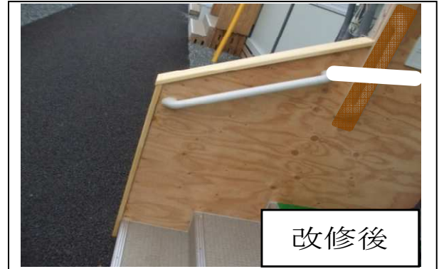
写真1：玄関入口の階段手すり